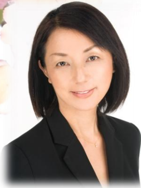
株式会社スマイル・ケア代表 歯科衛生士